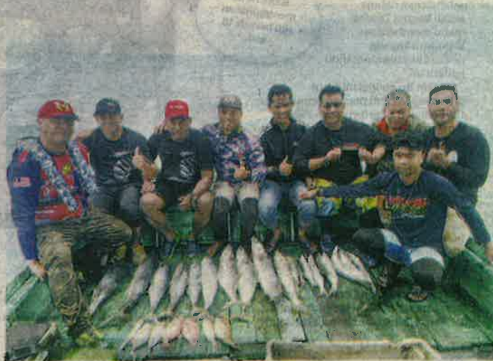
ANTARA hasil tangkapan ikan yang berjaya dinaikkan ahli Skala Mega Anglers ketika memancing di perairan Sedili, Kota Tinggi, Johor.