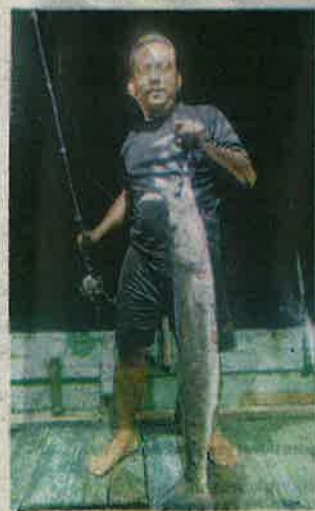
TRIP memancing adakalanya mengambil masa sehingga dua hari.

Menurutnya, perairan berkenaan menjadi 'port' kerana hasil lautnya yang pelbagai dan ikan yang menjadi sasaran mereka seperti ikan tenggiri, kerapu,