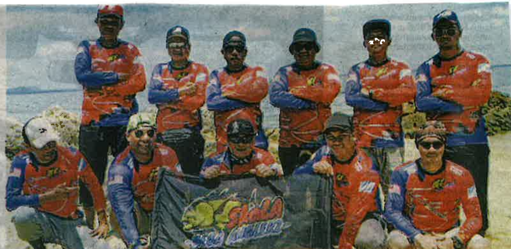
KUMPULAN Skala Mega Anglers dianggotai polis-polis bantuan Pelabuhan Tanjung Pelepas (PTP) yang berkongsi minat sama iaitu memancing.