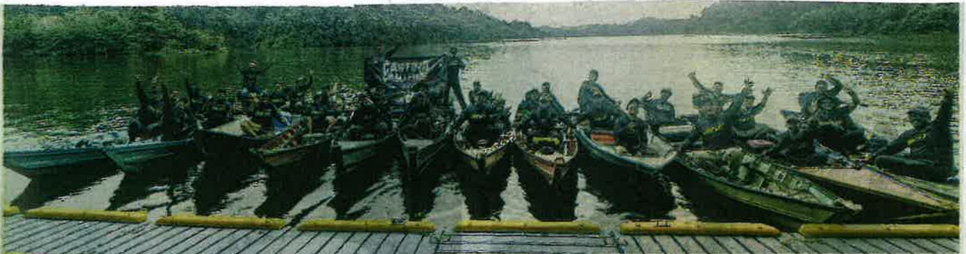
PARA peserta #Gubirattack bergambar berlatarkan Tasik Gubir di Sik, Kedah yang merupakan tasik buatan indah yang sesuai diangkat sebagai pusat ekopelancongan.