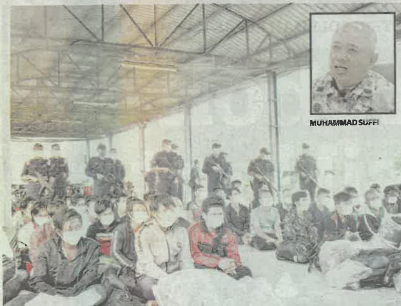
SEBAHAGIAN nelayan Vietnam yang berjaya ditahan APMM ketika ceroboh perairan negara melalui Terengganu baru-baru ini.

"Siasatan mendapati kesemua bot itu telah berada di perairan negara sejak awal pelaksanaan PKP Penuh dan telah mengaut 14 tan hasil laut termasuk ikan-