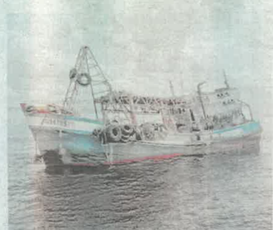
SALAH sebuah bot nelayan Vietnam yang disita kerana menceroboh perairan negara.

KUALA TERENGGANU - Menyamar sebagai bot tempatan dengan menggunakan nombor patil atau pendaftaran palsu merupakan modus operandi yang sering digunakan oleh nelayan Vietnam untuk mencerobohi perairan negara.