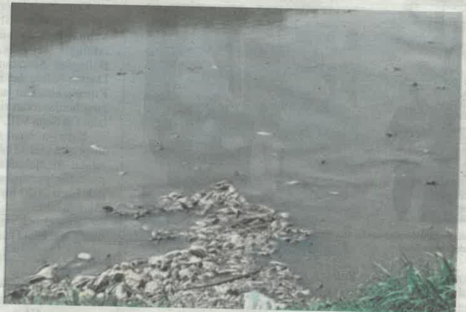
Tular kejadian pelbagai spesies ikan ditemui dihanyutkan air di Sungai Damansara berhampiran Seksyen 13 Shah Alam pada Rabu.

“Tolong pantau kilang buang sisa toksik di sungai ini dan jangan asyik tunggu rakyat sahaja membuat laporan,” katanya.