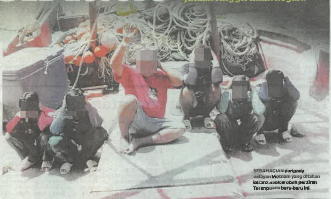
SEBAHAGIAN daripada nelayan Vietnam yang ditahan kerana menceroboh perairan Terengganu baru-baru ini.