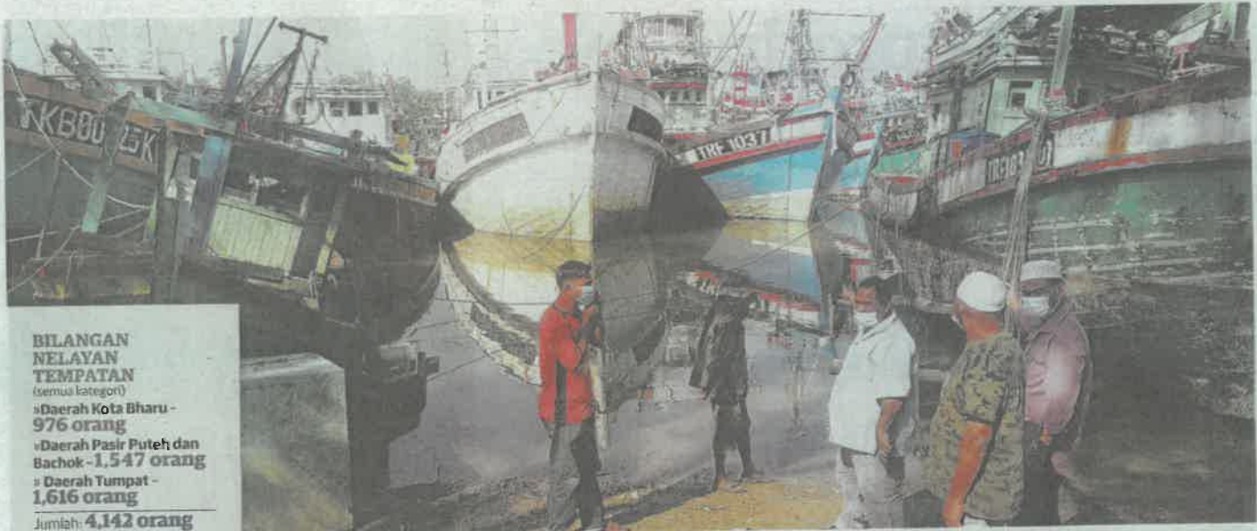
SEBAHAGIAN bot C2 yang tersadal sejak April tahun lalu kerana ketiadaan awak-awak nelayan di Tok Bali, Pasir Puteh, Kelantan.

BILANGAN NELAYAN TEMPATAN (semua kategori) »Daerah Kota Bharu - 976 orang »Daerah Pasir Puteh dan Bachok - 1,547 orang »Daerah Tumpat - 1,616 orang Jumlah: 4,142 orang