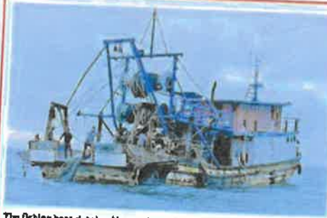
The fishing boat detained by marine police.